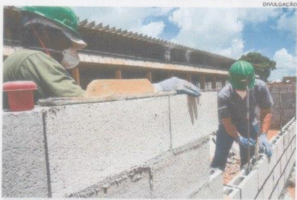
A Sondagem da Construção Civil foi realizada pela Fiema e CNI.

A Sondagem da Construção do Maranhão, elaborada pela Federação das Indústrias do Estado do Maranhão (Fiema) em parceria com a Confederação Nacional da Indústria (CNI), confirma que os níveis da atividade do setor da construção civil sofreram uma queda no 3º trimestre de 2022. No 2º trimestre os indicadores apresentaram a satisfação com a situação financeira em 47 pontos e com o lucro operacional em 42,9 pontos. Já no 3º trimestre esses indicadores caíram para 39,6 e 32,3 pontos, respectivamente. O resultado interrompe a trajetória de variação positiva que o setor vinha apresentando. O valor médio dos insumos e matérias-primas continuou o mesmo do 2º trimestre, 82,3 pontos, seguindo o comportamento de alta apresentado nos últimos trimestres. O índice que monitora a facilidade de acesso ao crédito diminuiu, chegando a 21,8 pontos, o menor índice em comparação a nível Brasil (40,1) e Nordeste (39,8). Mas essa não é a única dificuldade apontada na sondagem. As empresas citaram a escassez de capital de giro e a inadimplência dos clientes como suas