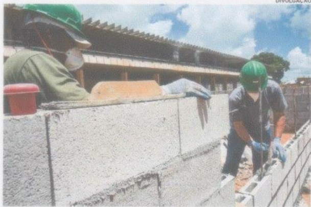
A Sondagem da Construção Civil foi realizada pela Fiema e CNI

Mas essa não é a única dificuldade apontada na sondagem. As empresas citaram a escassez de capital de giro e a inadimplência dos clientes como suas